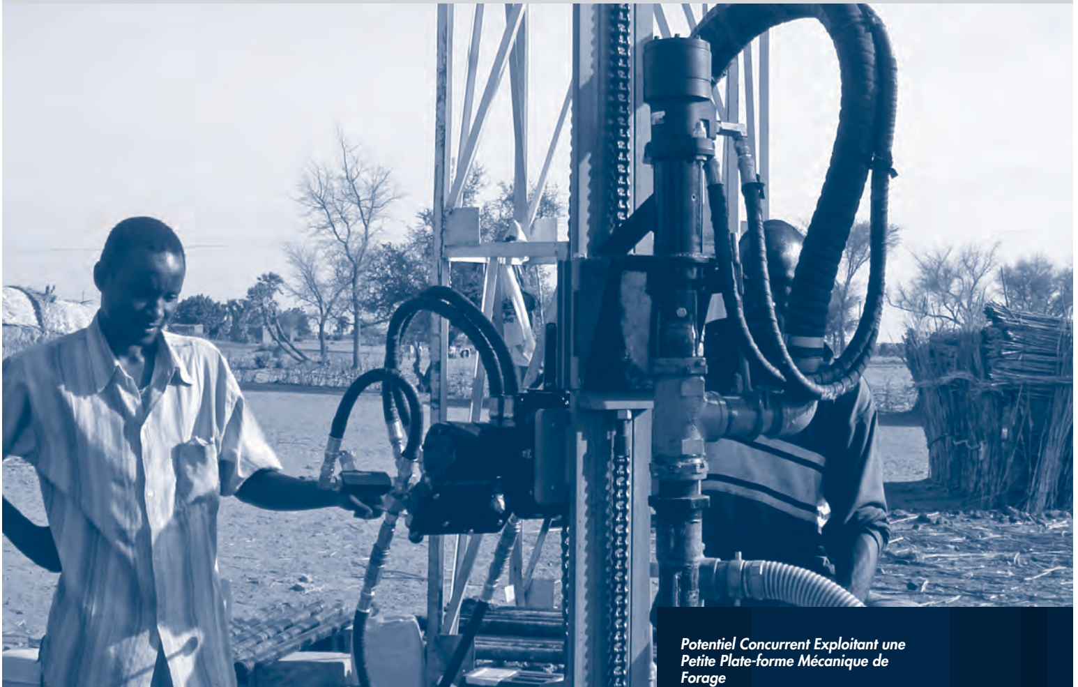
Potentiel Concurrent Exploitant une Petite Plate-forme Mécanique de Forage